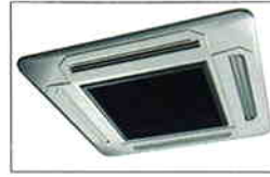
天井カセット型エアコン (正方形タイプ、950mm角/760mm角)